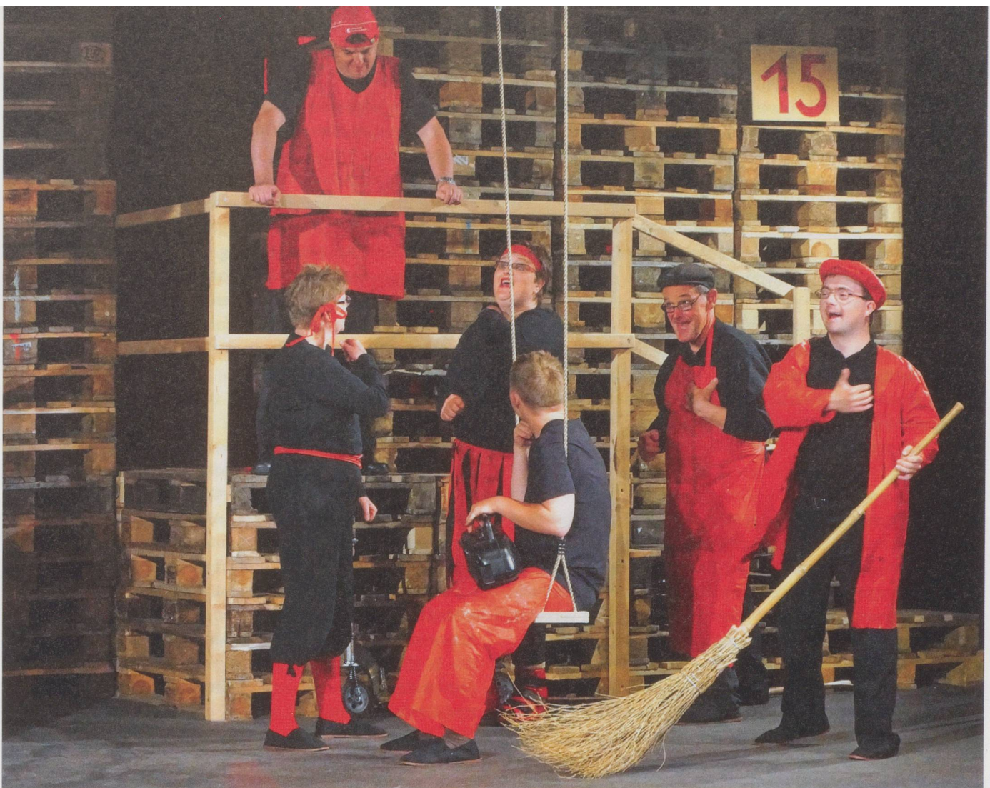
Menschen mit Behinderung spielen Theater (Stiftung Rütimattli, Sachseln OW, Juni 2012): Kompetenzen und Stärken kennen.