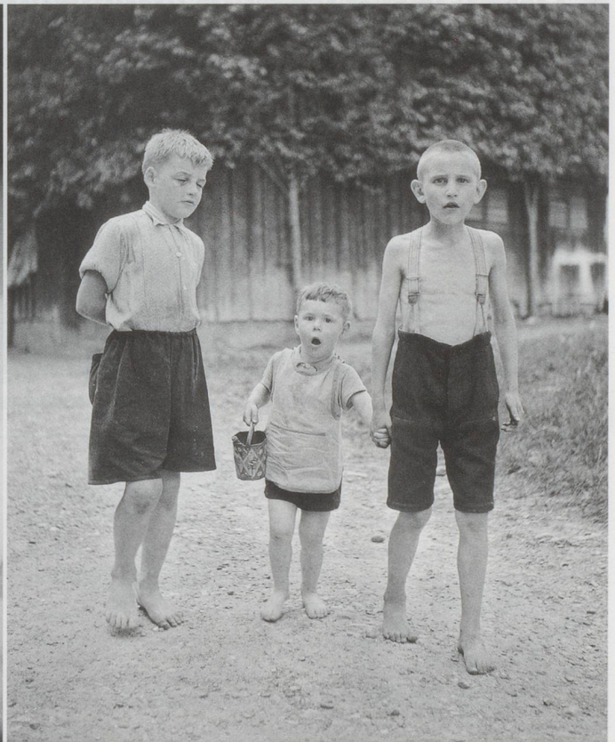
Die Last der Erinnerung: Buben in der Erziehungsanstalt Sonnenberg, Kriens, 1944.