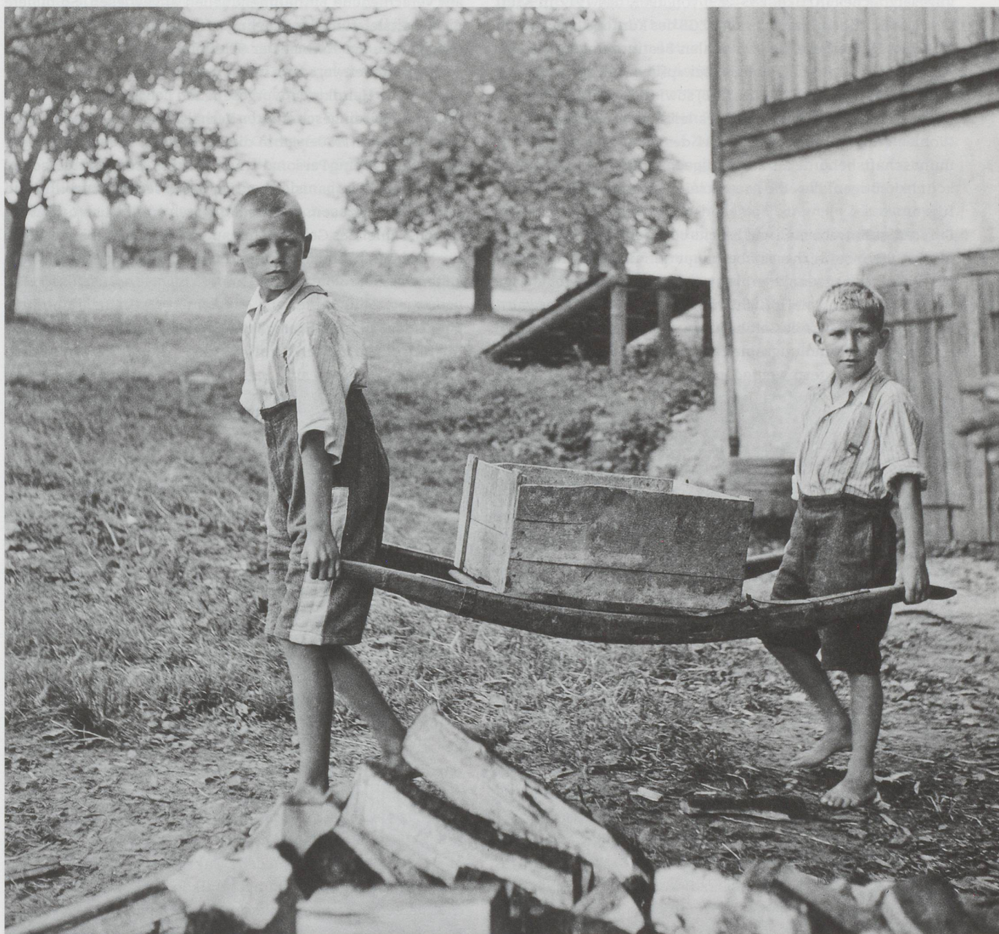
Die Arbeitsleistung der Kinder bildete eine existenzielle Finanzierungsquelle der Heime: Buben in der Erziehungsanstalt Sonnenberg, Kriens, 1944.