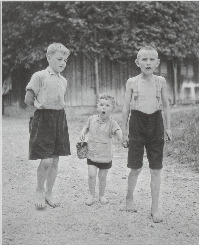
Die Last der Erinnerung: Buben in der Erziehungsanstalt Sonnenberg, Kriens, 1944.