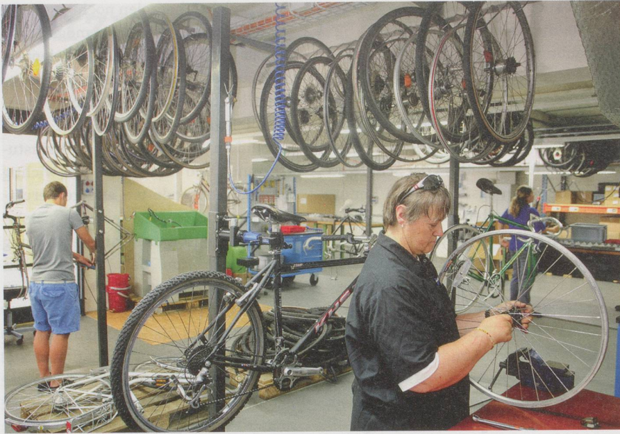
Velowerkstatt der Brühlgut Stiftung: Attraktives Arbeitsfeld.

Brühlgut Stiftung in Winterthur besteht die Innovation darin, dass mit der Velowerkstatt ein neues, attraktives Arbeitsfeld für Menschen mit Behinderung geschaffen wurde. In Kooperation mit Partnerbetrieben «Velos für Afrika» werden schweizweit Occasionsvelos gesammelt und für den Export nach Afrika aufbereitet. Die gesamte Preissumme beträgt 3500 Franken.