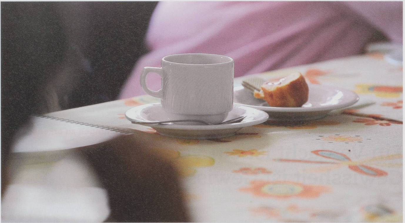
Zusammensitzen bei Kaffee und Kuchen – ein Bild des Friedens oder nur Fassade? Gewalt und Misshandlungen an alten Menschen sind oft nicht auf den ersten Blick zu erkennen.