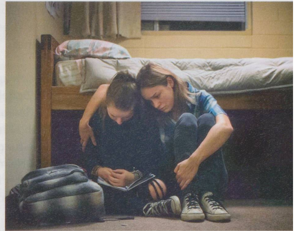
Szene aus «Short Term 12»: Bewegende Geschichte über sexuellen Missbrauch.

«Short Term 12», USA, Regie: Destin Daniel Cretton, 2013, 96 Minuten