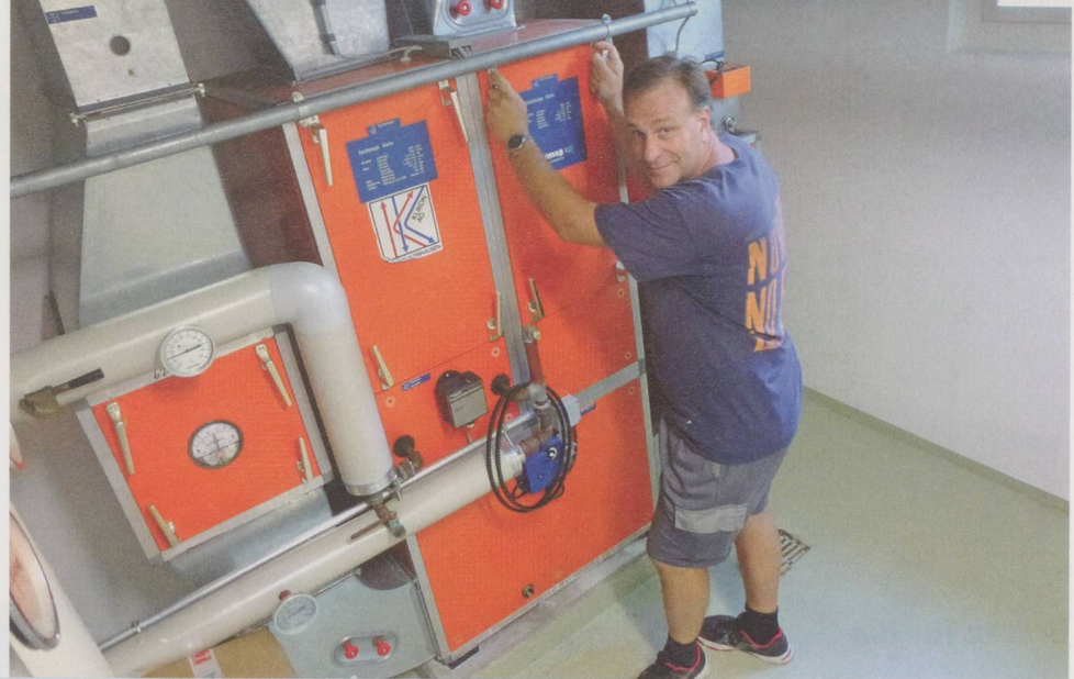
nden, Mieter und hilft im Rahmen seiner Möglichkeiten», heisst es im Berufsbescrieb.