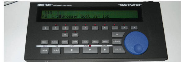
Foto: Bedienung zur MIDI-Anlage