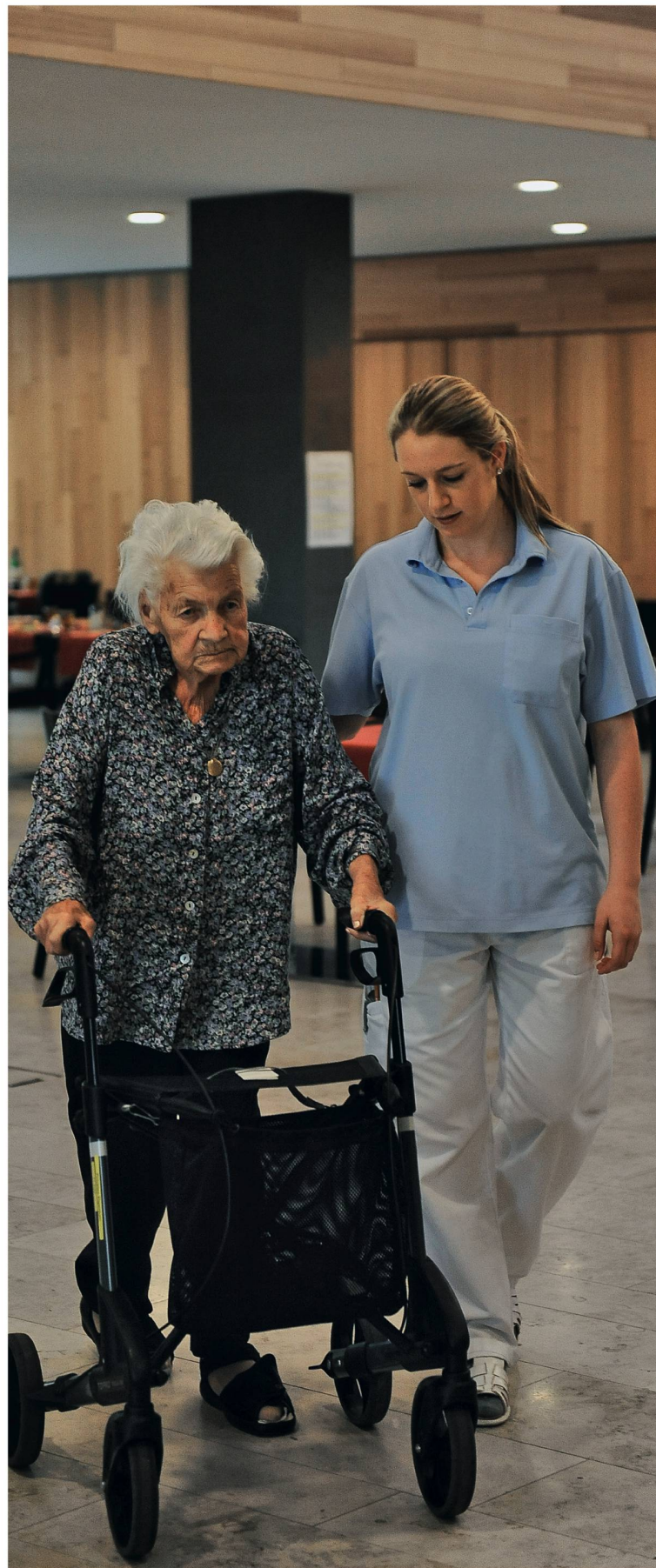
Es gibt Tage, an denen Frau Seiler* eine düstere Miene macht – Vorboten von Aggression (nachgestellte Szene).

Judith Weiss erzählt von Frau Seiler*, die unter mittelschwerer Demenz leidet. Die 89-Jährige legt grossen Wert auf höfliche Umgangsformen und grüsst die Leute freundlich, die ihr begegnen, wenn sie mit dem Rollator auf dem Gang und in den