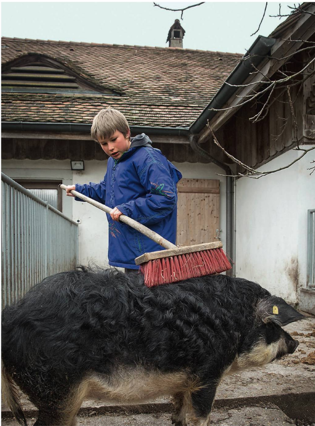
Wenn Dorian mit der grossen roten Bürste über Miss Piggys schwarzgelockte Borsten rubbelt, geniesst sie das sichtlich.