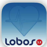
der mobile Pflegemanager