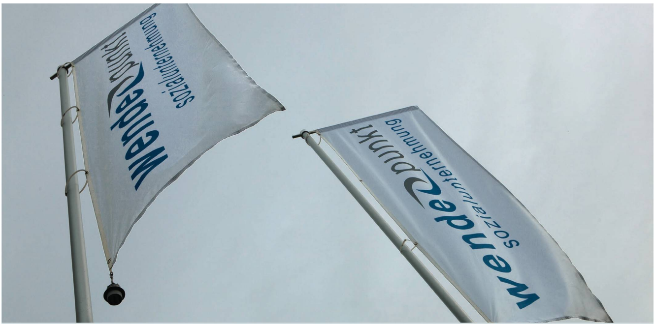
Die Sozialunternehmung Wendepunkt, 1993 gegründet, hat ein rasantes Wachstum hinter sich: Nun ist es Zeit, die Administration zu modernisieren.