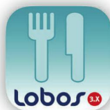
die mobile Mahlzeitenverwaltung