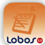
die mobile Leistungserfassung