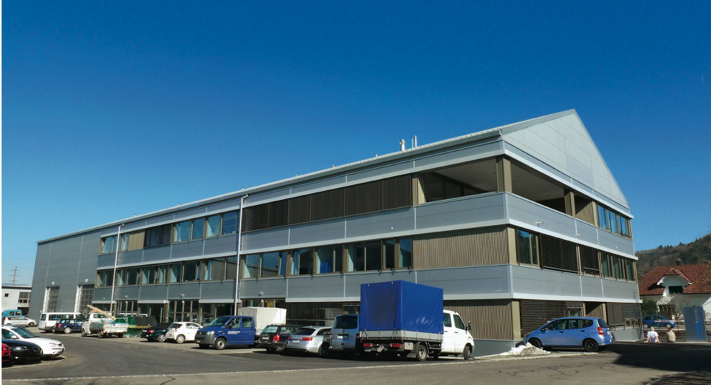
Das Betriebsgebäude der Stiftung Wendepunkt in Muhen AG: Die Komplexität des Unternehmens war ohne neue Software administrativ kaum mehr zu bewältigen.