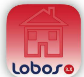
der mobile Gebäude- und Anlagenmanager