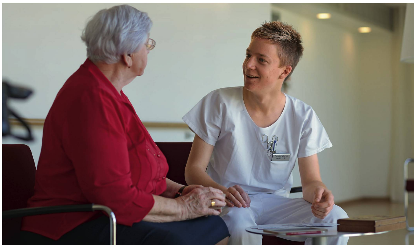
In Zukunft mehr Mitsprache: Ältere Menschen werden sich nicht mehr damit zufriedengeben, Pflege über sich ergehen zu lassen.