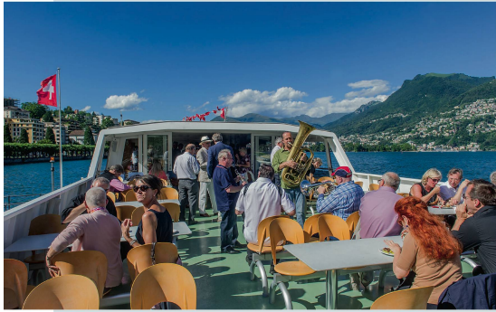
Auf dem Luganersee mit musikalischer Unterhaltung: Die Delegierten von Curaviva Schweiz nach der Versammlung.