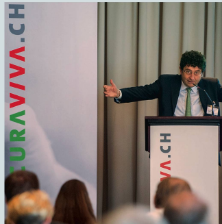
Der Gesundheitsdirektor des Kantons Tessin, grüsste die Delegierten.