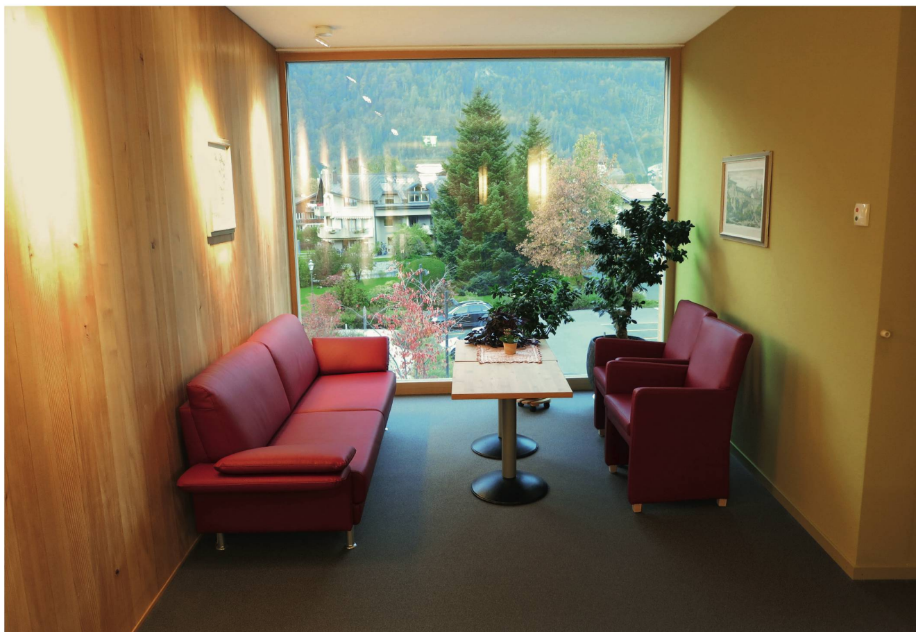
Wohnlichkeit, die keinen Vergleich zu scheuen braucht: Sitznische mit Aussicht im Alters- und Pflegezentrum Rosenau in Matten bei Interlaken.

Wenn das Bedürfnis nach Sicherheit grösser wird, wenn Vereinsamung droht, weil der Partner stirbt und die Kinder wegziehen, >>