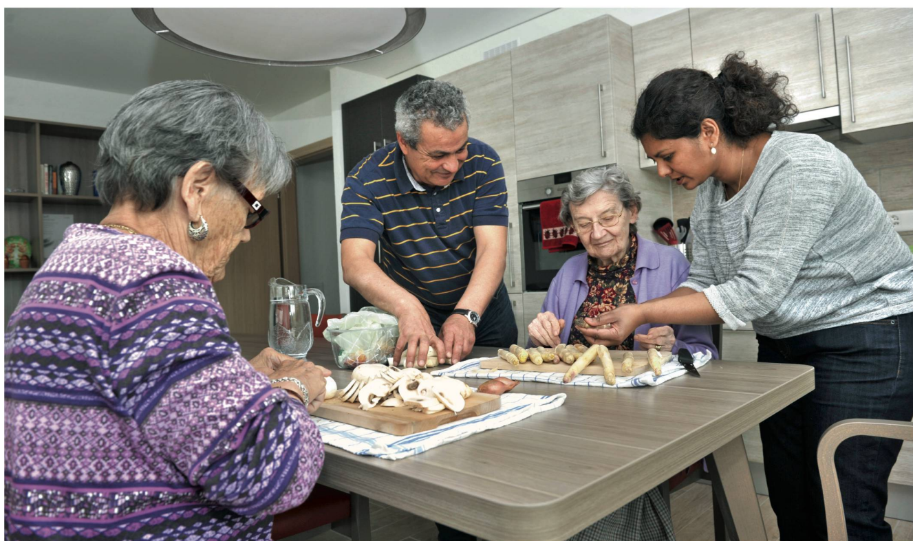
Wohngemeinschaft von Menschen mit einer Demenz-Krankheit in Orbe: Selbstständigkeit erhalten so lange es geht.

Es geht täglich darum, das Gleichgewicht in der Wohngruppe aufrechtzuerhalten.