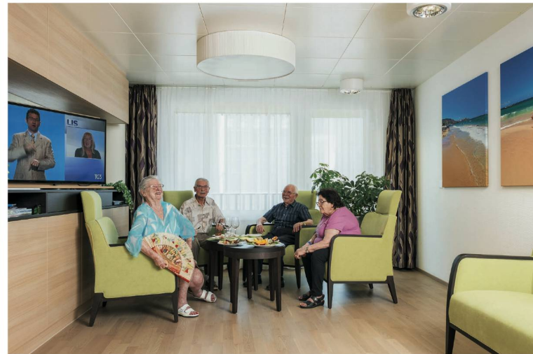
Auf dieser Abteilung plaudern die Bewohnerinnen und Bewohner oft miteinander. Lauter und lustiger als anderswo.