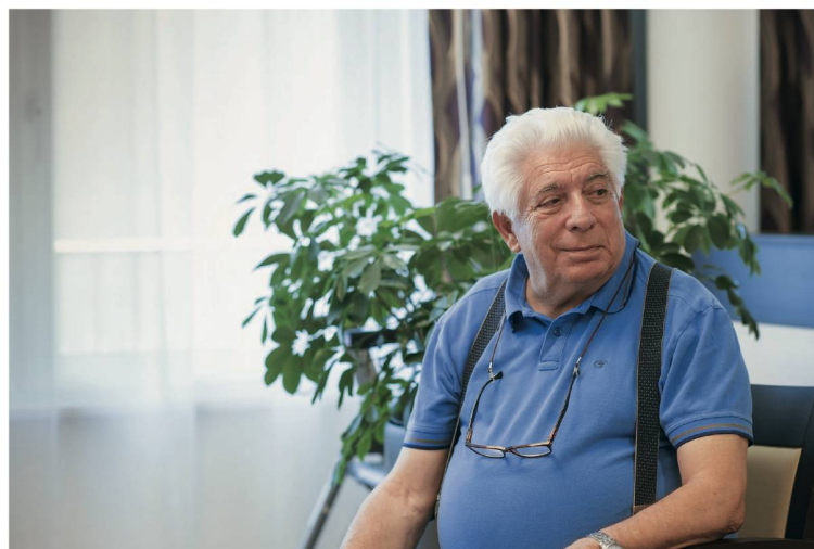
Der stattliche Herr mit dem weissen Haarschopf macht gerne mal einen Scherz.