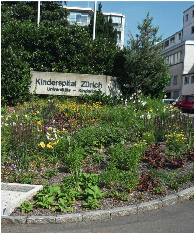
Artenreiche Staudenmischpflanzungen dienen als Visitenkarte im Eingangsbereich des Kinderspitals Zürich.

zentraler Aspekt. Auch für deren Kalkulation braucht es geeignete Instrumente. Die Berechnung der aktuellen und die Abschätzung zukünftiger Kosten sind wichtig, um die Weiterentwicklung der Anlage so zu planen, dass eine wirtschaftliche, effiziente Pflege möglich ist. In diesem Zusammenhang stellt sich die Frage, ob eigenes Personal oder ein privates Unternehmen die anfallenden Unterhaltsarbeiten ausführen sollen. Mit der Erfassung aller gärtnerischen Arbeiten und deren Kosten sind gleichzeitig alle wichtigen Informationen für eine externe Ausschreibung und Vergabe vorhanden.