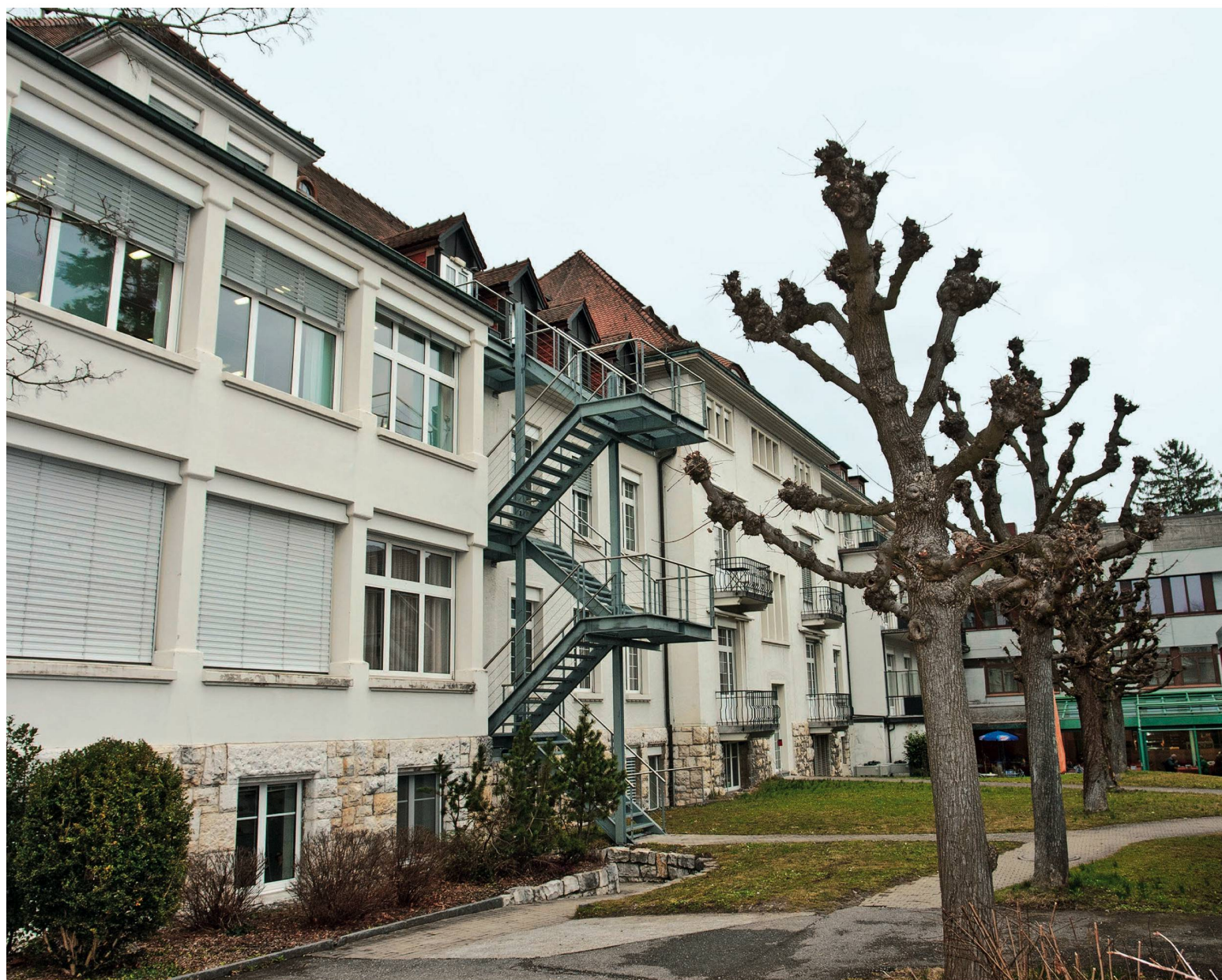
Gleich wie für die Geburt braucht es auch für das Ende des Lebens Fachkräfte: Sterbehospiz in Brugg AG.

mit der «Pflegefinanzierung», die Anfang 2011 in Kraft trat, wurden entscheidende Weichen gestellt: Wir brauchen weiterhin eine gute Krankenversicherung (keine Einteilung der Versicherten in Risikogruppen); es ist richtig, dass mit der KVG-Änderung die Kriterien für den Risikoausgleich unter den Kassen nicht nur Alter und Geschlecht, sondern auch Folgekosten der Anzahl Pflegetage in Spital oder Pflegeheim mit einbeziehen, damit die «Jagd nach guten Risiken» bei den Kassen weniger attraktiv ist. Die Verfeinerung wurde jetzt noch mit dem Morbiditätsfaktor ergänzt; die neue Finanzierung der Langzeitpflege brachte Erleichterungen: Der Patientenanteil darf nicht höher als 20 Prozent der Kosten betragen, und niemand darf wegen seiner Pflegebedürftigkeit zum Sozialfall werden. Der Zugang zu Ergänzungsleistungen wurde erleichtert, die öffentliche Hand sollte die Restkosten übernehmen. >>