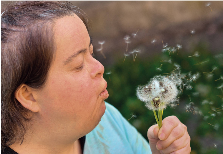
Auch Menschen mit einer intellektuellen Beeinträchtigung erreichen ein höheres Alter und möchten ihre Wünsche und Sorgen in diesem Lebensabschnitt kundtun.