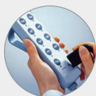
Handschalter inkl. Schwesternfunktion

Die neuen PERFECTA-Pflegebetten sind ein grosser Wurf! Branchenkenner attestieren uns das beste Preis-Leistungsverhältnis im Schweizer Markt. Um Sie von diesen hochwertigen Pflegebetten zu überzeugen, haben wir uns etwas ganz Besonderes einfallen lassen: