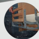
Vertikale Absenkung der zweigeteilten Seitengitter