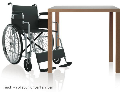
Tisch - rollstuhlunterfahrbar

hauswirtschaftpunkt.ch info@hauswirtschaftpunkt.ch