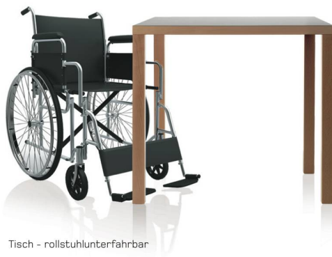
Tisch - rollstuhlunterfahrbar

hauswirtschaftpunkt.ch info@hauswirtschaftpunkt.ch