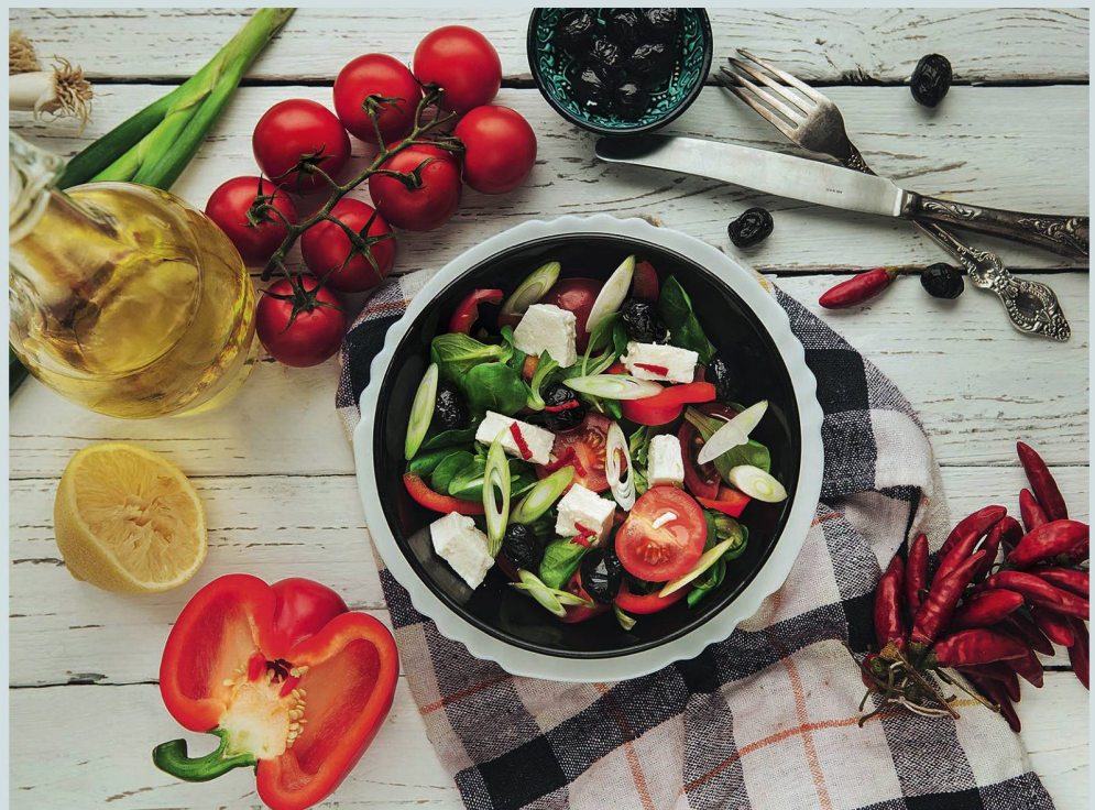
Empfehlenswert ist eine mediterrane Ernährung mit viel Früchten und Gemüse, aber auch mit Eiweiss, wie es beispielsweise im griechischen Schafskäse enthalten ist.

«Gutes Sehen und Hören sind ebenso wichtig wie Gesundheit von Muskeln und Knochen.»