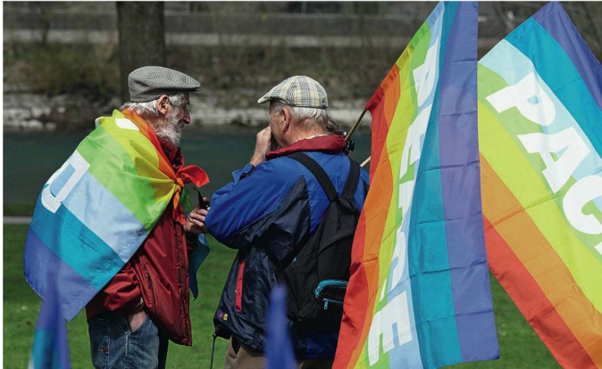
Das Hirn anregen beim Schachspielen, den Körper fit halten mit Spaziergängen und sozial aktiv bleiben wie die beiden Senioren bei der Teilnahme an einer Friedensdemonstration: All diese Faktoren helfen, gesund alt zu werden.

wollten zudem wissen, wie es um die Erhaltung der Autonomie und um die Lebensqualität steht.