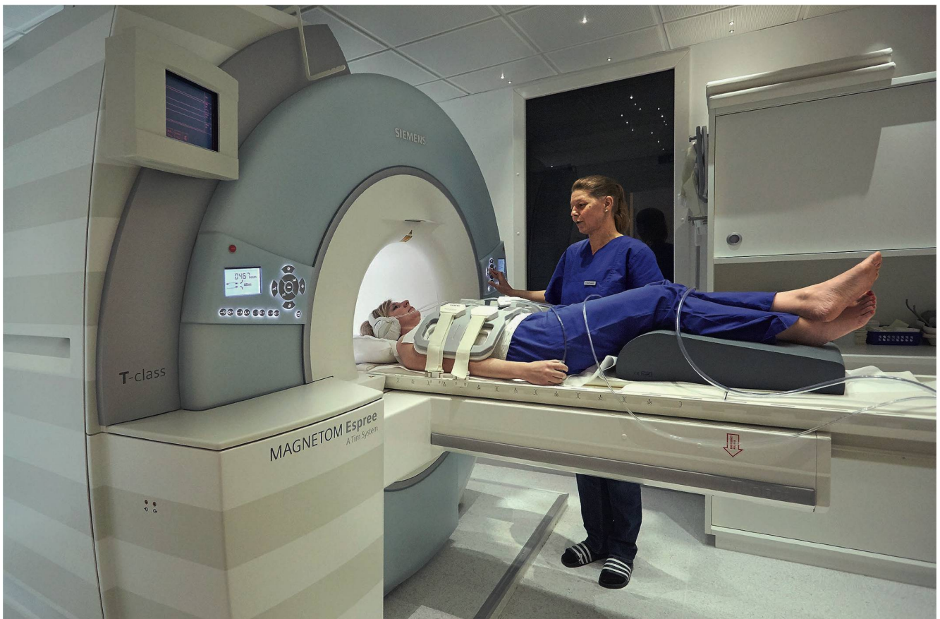
Die immer höheren Ansprüche der Gesellschaft an das Gesundheitssystem tragen wesentlich zum Kostenwachstum bei. Sie sind ein starker Motor für den medizinisch-technischen Fortschritt.

Neben den Auswirkungen des demografischen Wandels berücksichtigt die Finanzverwaltung die gesamtwirtschaftliche Einkommensentwicklung als wichtigen Kostentreiber im Gesundheitswesen. So stiegen in der Vergangenheit die Gesundheitsausgaben überproportional zum Volkseinkommen an. Auf der Nachfrageseite erkläre sich dieses Wachstum mit den immer höheren Ansprüchen der Gesellschaft an das Gesundheits-