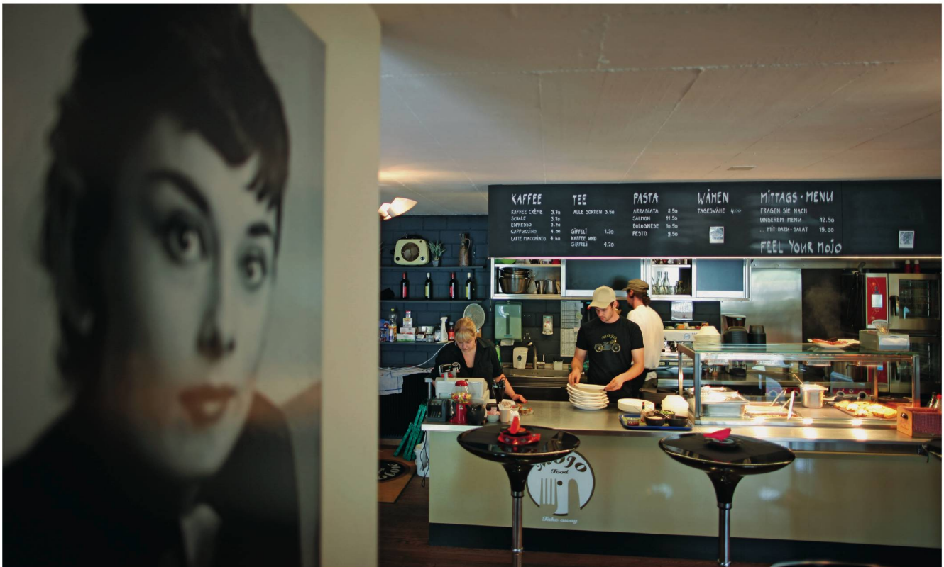
Restaurant Mojo der Trinamo AG in Aarau: Tische, Boden und Bar aus den eigenen Werkstätten.