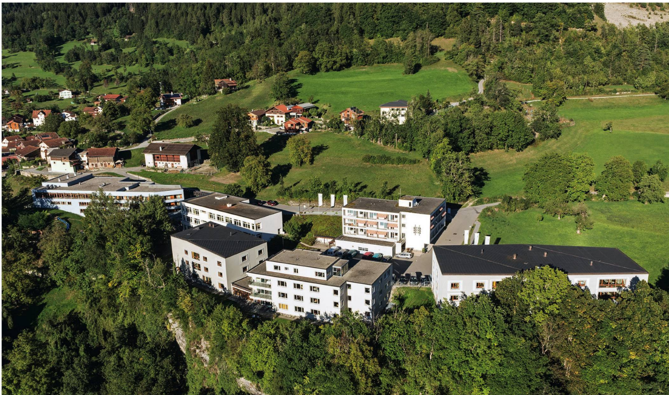
Die Stiftung Scalottas im bündnerischen Scharans: Treffpunkt für soziale Anlässe. So bleiben die Bewohnerinnen und Bewohner nicht abgeschottet.

de: Gummibärchen und Knabberzeug liegen bunt nebeneinander. Pädagogisch hin, gesund her, solche kleinen Freuden gehören zur Mitbestimmung. Auch andere Kinder gehen am Kiosk «gänggelen».