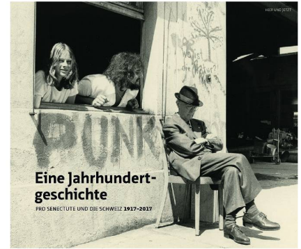
Kurt Seifert «Eine Jahrhundertgeschichte – Pro Senectute und die Schweiz 1917–2017», Verlag «hier und jetzt», 168 Seiten, 39 Fr.

über die Einführung der AHV 1948 bis in die heutige Zeit, wo Langlebigkeit und die Sicherung der Altersvorsorge im Vordergrund stehen und Pro Senectute sich für ein aktives, erfülltes Alter engagiert. Reich bebildert zeigt das Buch, wie dramatisch sich das Altern in den letzten 100 Jahren gewandelt hat und welche grosse Rolle tragfähige sozialer Netze spielten.