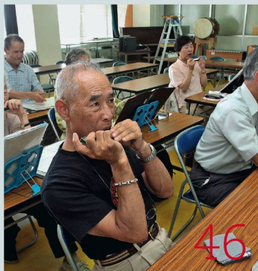
Alt werden in Japan