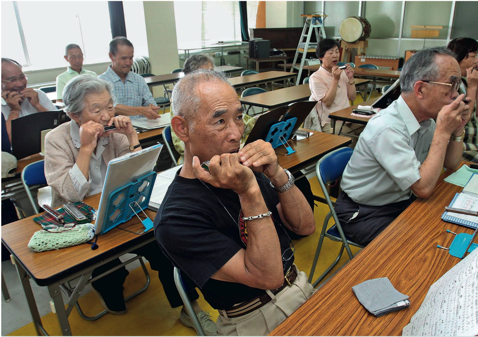
Japanische Senioren im Mundharmonika-Kurs: «Durch ein aktives Leben bleiben die Alten fit und sozial vernetzt.»