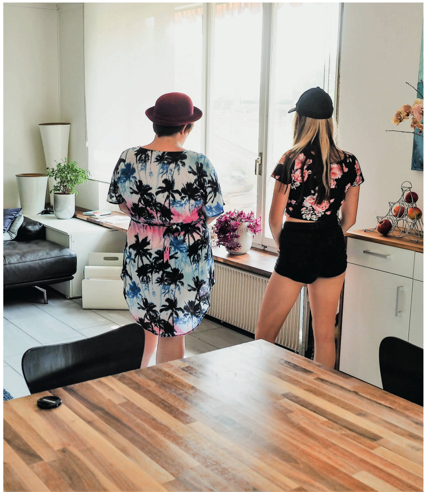
Zwei Mädchen in der Stube der Wohngemeinschaft «Perron 12» in Dottikon AG: «In der Adoleszenz bricht oft auf, was den Kindern in den ersten Lebensjahren an Verletzungen zugefügt wurde».

Es sind tatsächlich nicht die lauten, aggressiven, kurz: die nach gängigem Bild schwer erziehbaren Kinder und Jugendlichen, die in der «Perron 12»-Familie leben. Es sind junge Menschen, die in ihrem Leben verunsichert wurden, denen das Vertrauen in andere Menschen abhandengekommen ist, die still geworden sind, weil ihnen nie jemand zugehört hat. Sie sind vernachlässigt worden, wurden Zeugen von Gewalt oder selbst misshandelt, erlebten >>