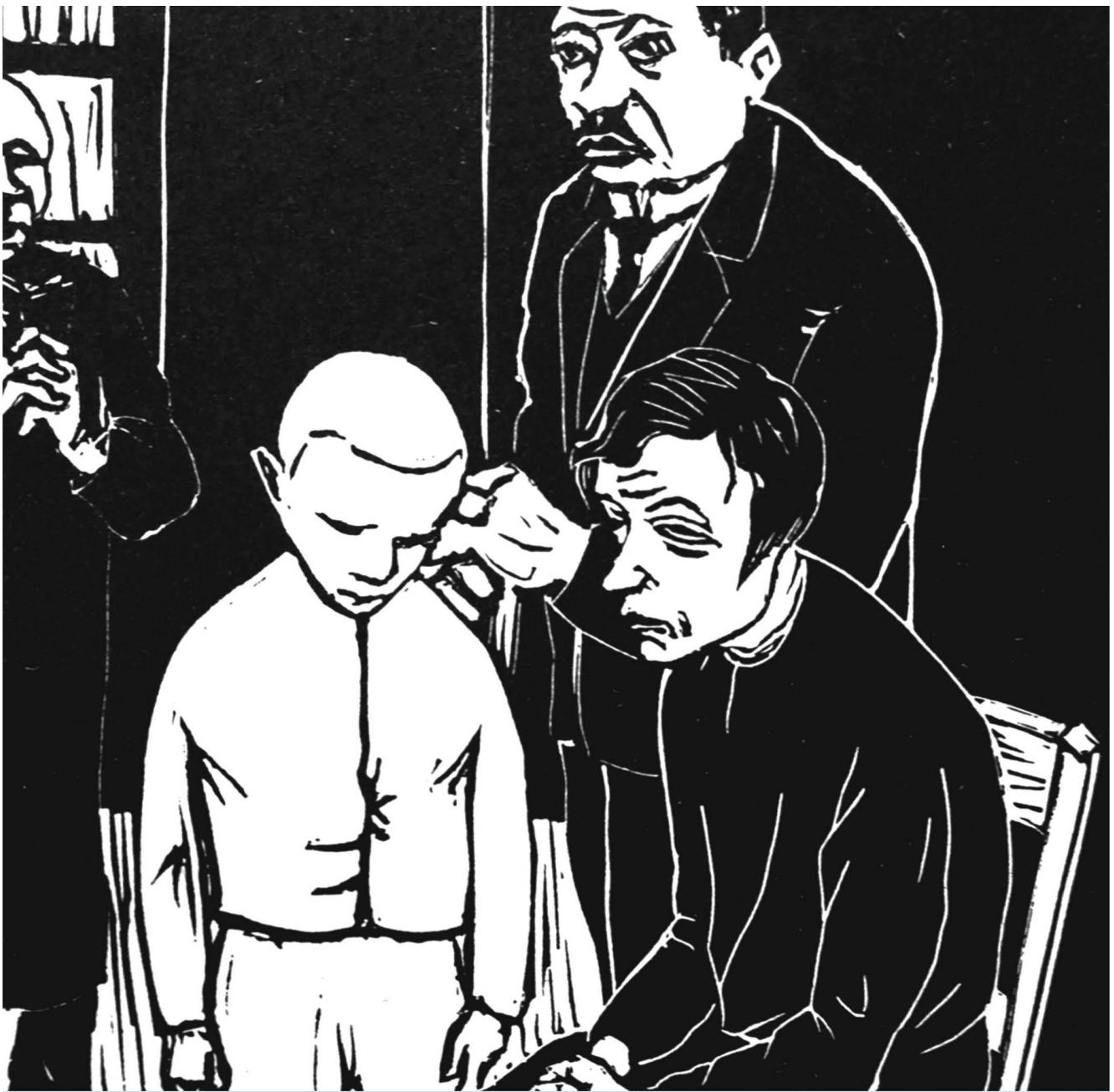
Körperliche Züchtigung als Strafmassnahme: Die Rechte der Kinder sind eine moderne Erfindung.