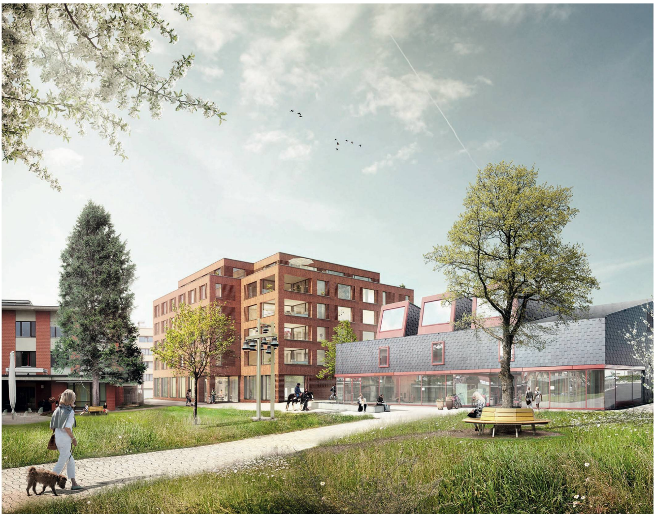
Die Projekt-Visualisierung zeigt das geplante Wohnhaus A (Bildmitte) am Rand des Geländes. Hier werden zwei Wohngruppen untergebracht. Die insgesamt 12 Bewohner haben viel Raum für individuelle Gestaltung.