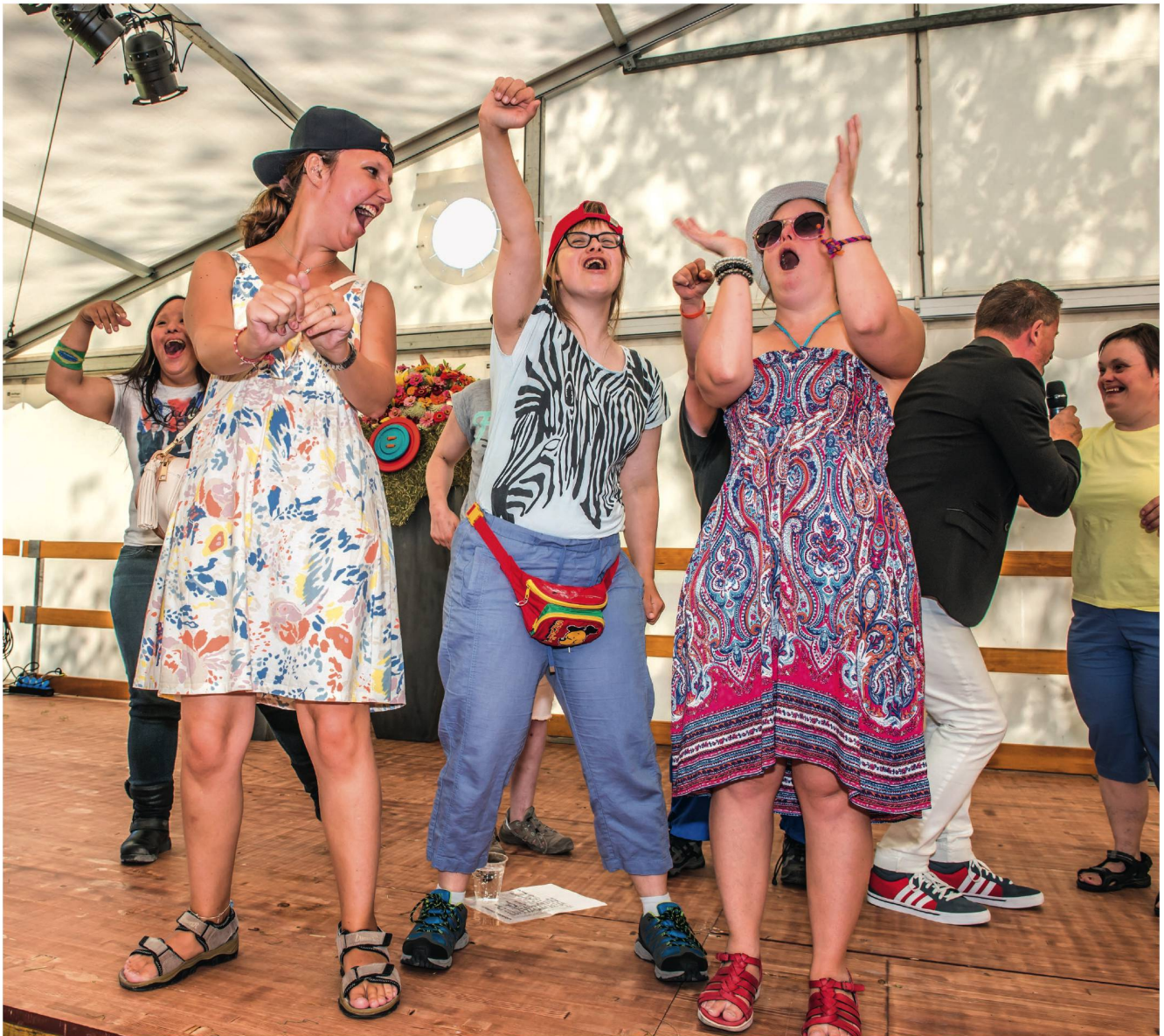
Ausgelassene Stimmung am «Dörfli»-Fest. Im Wagerenhof wird oft gefeiert.