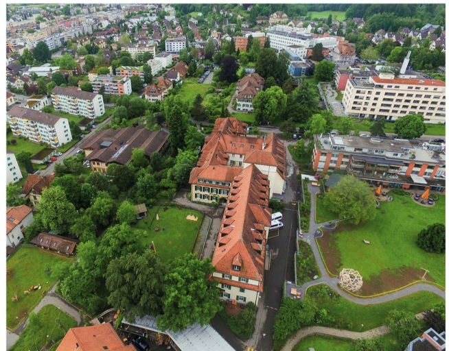
In der Mitte des weitläufigen Wagerenhof-Areals steht der über 100-jährige Altbau, der jetzt saniert wird.

Vor zwei Jahren hat die Stiftung bereits eine Pflegegruppe und eine Demenzwohngruppe eingerichtet. Der nun geplante grundlegende Umbau sieht die Schaffung einer zweiten Demenzwohngruppe vor, inklusive eines umzäunten Demenzgartens mit