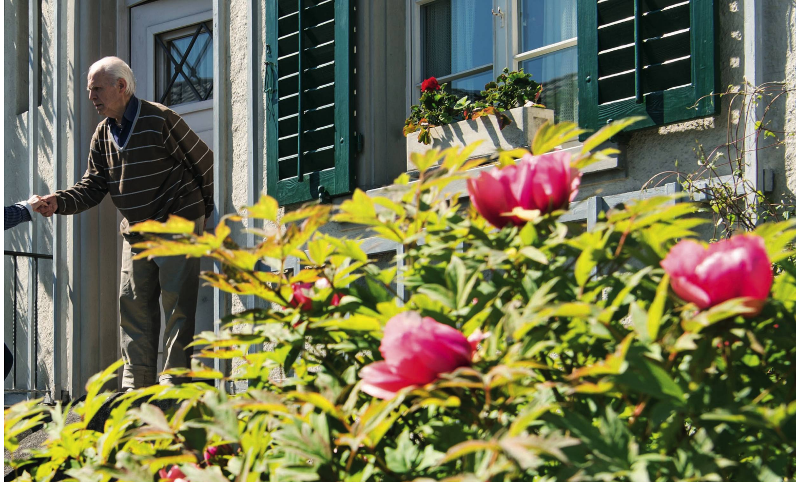
gehen die Siedlungs- und Wohnassistentinnen spontan auf die Seniorinnen und Senioren der Gemeinde zu. einander bekannt, damit sie sich gegenseitig unterstützen oder gemeinsam etwas unternehmen.