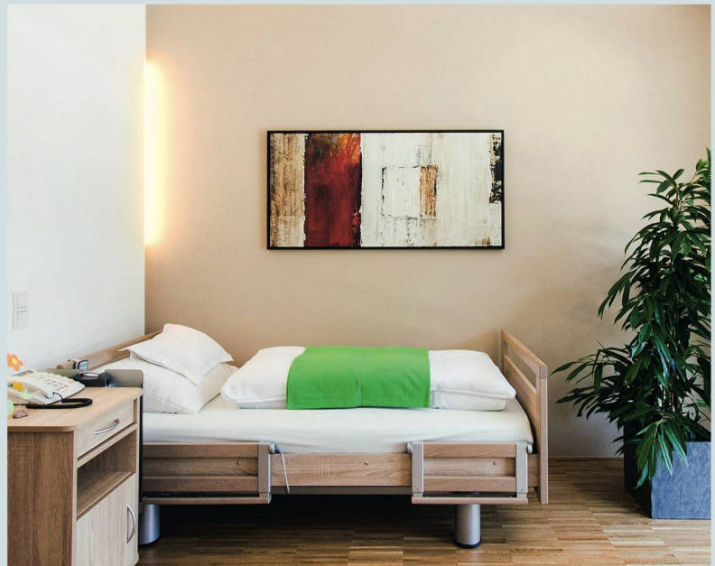
Für Betagte ist ein zu kleines Angebot an Pflegeplätzen problematisch.

Für Betagte ist ein (zu) kleines Angebot an Pflegeplätzen jedoch problematisch: Erstens geht dieses gemäss vorangehendem Artikel nicht immer mit ausgebauten ambulanten und intermediären Angeboten einher oder es wird – zum Beispiel wegen hoher Tarife – nicht genutzt. Zweitens können bei zu wenig Pflegeplätzen Menschen nicht in ein Heim gehen, welche trotz niedriger Pflegestufe eine Rundum-Versorgung im Haushalt, eine Person in Rufweite, eine Tagesstruktur oder ein soziales Miteinander benötigen. So müssen sie weiterhin in den eigenen vier Wänden leben, trinken und essen dort zu wenig, vereinsamen, verwahrlosen oder haben Angst. Drittens können Hochbetagte ihren Haushalt nicht auflösen, so lange sie noch die Kraft dazu haben. Sie können nicht an einen Ort ihrer Wahl ziehen, sondern müssen im Notfall mit einem Platz Vorlieb nehmen, der gerade frei ist, möglicherweise auch in einem Mehrbettzimmer. Viertens wird die Atmosphäre ei-