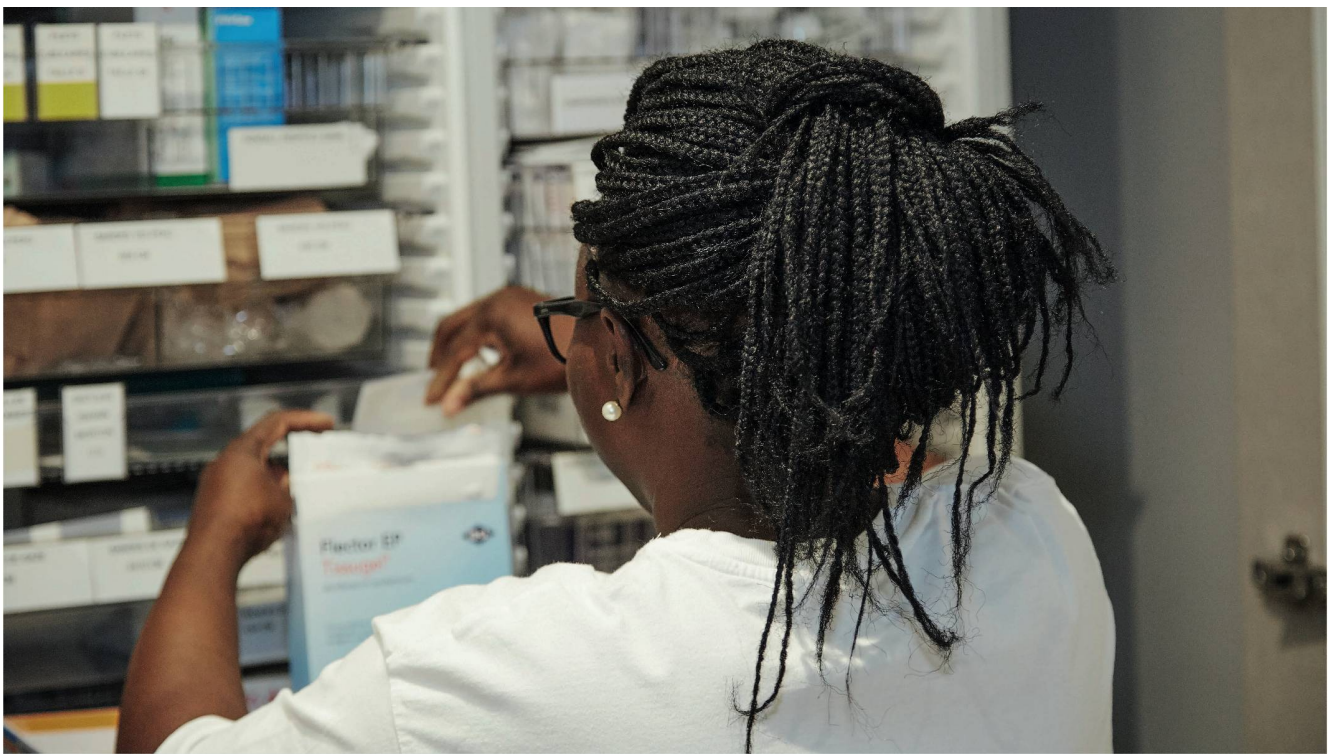
Die Verabreichung zu vieler Medikamente betrifft praktische alle Pflegeheime. Einer von mehreren Qualitätsindikatoren misst den Anteil an Bewohnern, die in einem bestimmten Zeitraum neun und mehr Wirkstoffe einnahmen.