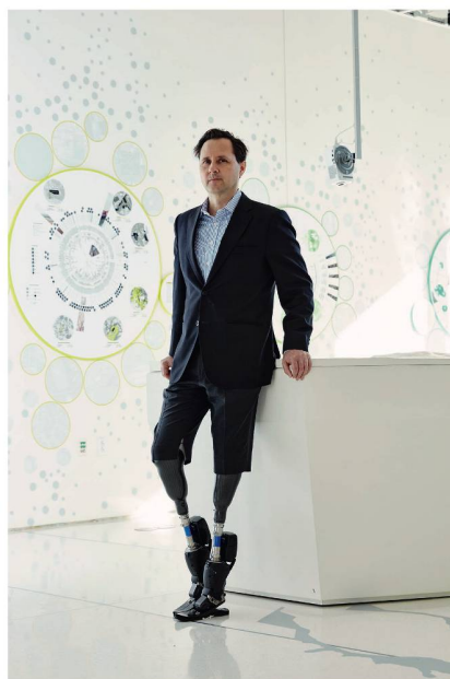
Hugh Herr: Glauben an die Technik.

Der nach einem Kletterunfall beinamputierte Hugh Herr, 52, Professor am renommierten Massachusetts Institute of Technology (MIT) hat am Swiss Innovation Forum seine Vision einer behindertenfreien Welt skizziert. Schlüssel dazu sei moderne Technik. «Nicht ich bin behindert», sagte er, «sondern die Technik.» Er ist felsenfest davon überzeugt, dass physische Behinderungen einst eliminiert werden können. «Mit der Technik kann ich alles tun, ohne sie bin ich ein Krüppel», beschreibt er die eigene Situation. Die Technik könne heute Signale an die Extremitäten übertragen und zunehmend sogar den verlorenen Tastsinn zurückbringen. Dank Stammzellentechnologie könnten auch verletzte Wirbelsäulen repariert werden. In 10 bis 15 Jahren, rechnet Herr, seien «aktive» Schuhe auf dem Markt, die mit synthetischen Wadenmuskeln das Laufen und Rennen