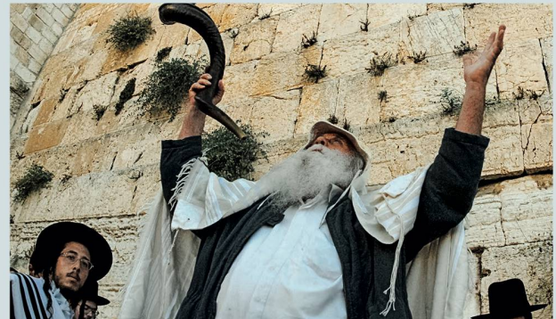
Jüdisches Fest Jom Kippur: Rituale geben Sicherheit

Sie haben vor allem die Funktion einer sozialen Zusammengehörigkeit. Nehmen wir als Beispiel einen Regentanz: Wer