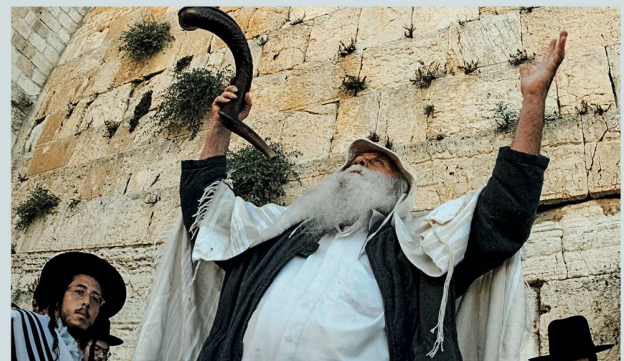
Jüdisches Fest Jom Kippur: Rituale geben Sicherheit

Sie haben vor allem die Funktion einer sozialen Zusammengehörigkeit. Nehmen wir als Beispiel einen Regentanz: Wer