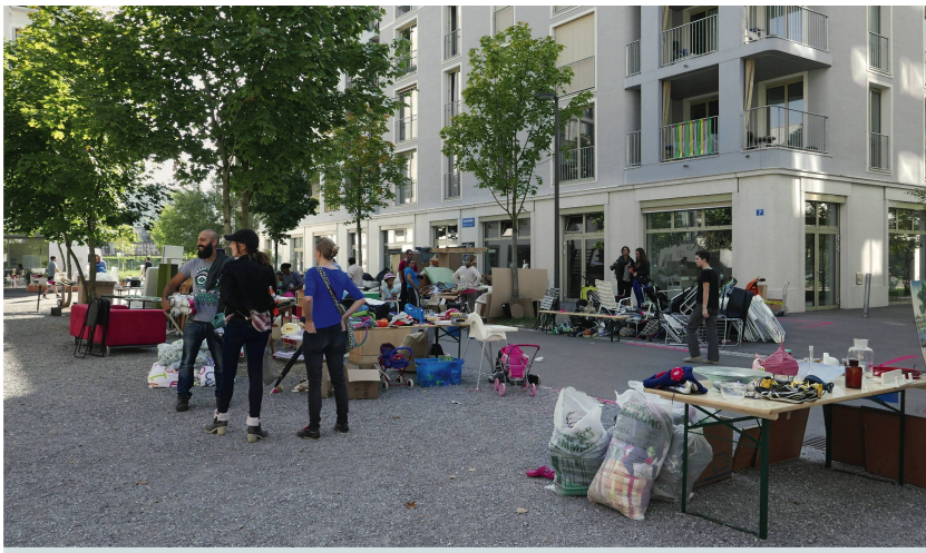
Flohmarkt auf dem Hunziker-Areal in Zürich-Leutschenbach: «Grosszügig Begegnungsräume geschaffen.»

Auch Architekten und Planer lernen von der Geschichte. Wir lesen die Geschichte und untersuchen: Warum funktioniert etwas, und wie ist das in der heutigen Zeit zu interpretieren und umzusetzen?