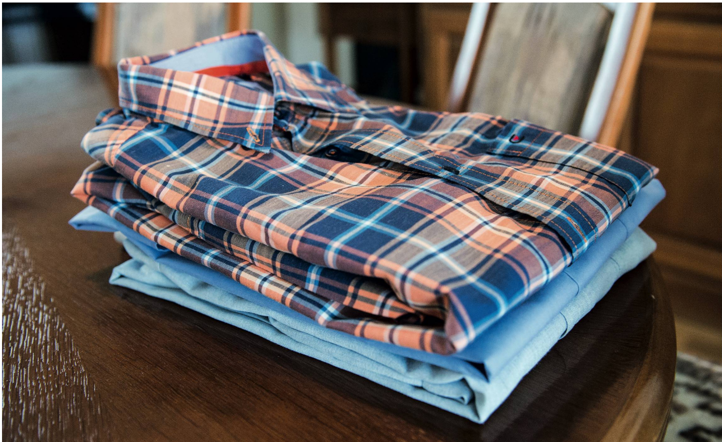
Gebügelte Hemden: Dienstleistungen nach Bedarf.