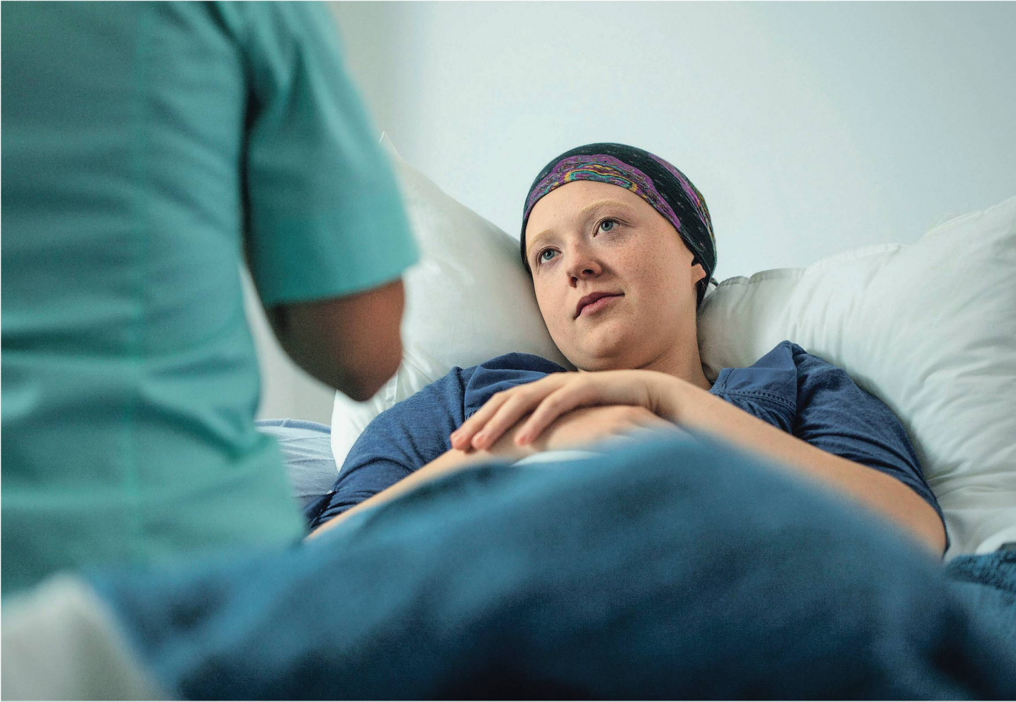
Patientin mit einer seltenen Krankheit: Wer jung auf stationäre Pflege angewiesen sind, fühlt sich oft nicht ernst genommen.

ger von 10000 Personen betrifft. Heute sind in der Schweiz etwa 580000 Menschen von einer seltenen Krankheit betroffen, also gut 7 Prozent der Bevölkerung.