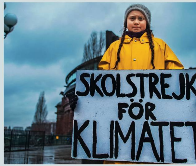
Aktivistin Thunberg: Grosse Klarheit.