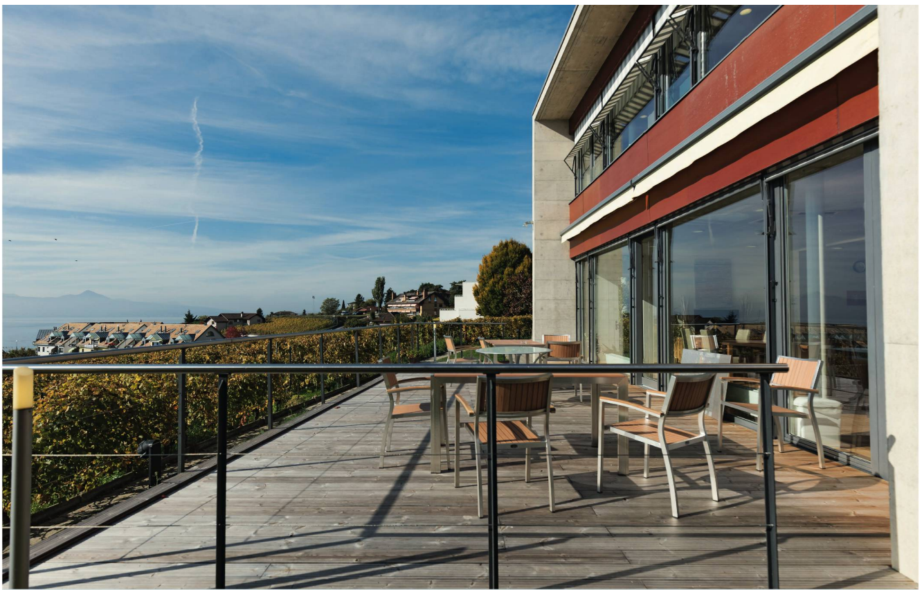
Balkon des Hôpital du Lavaux: Hier wird im Rahmen eines Pilotprojekts eine von zwei Palliativstationen geführt. Sie stellt quasi ein Bindeglied zwischen Akutversorgung und Alters- und Pflegeheim dar.