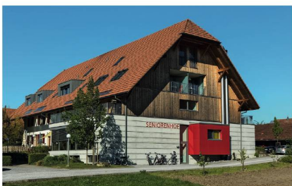
Seniorenhof Iffwil: Mehr als ein Heim.

richterhof» ist individuell gestaltbar und richtet sich nach den Bedürfnissen der Bewohner. Der Seniorenhof Iffwil bietet nebst 18 Pflegeheimplätzen auch Angebote für Betreutes Wohnen sowie Betreuungsangebote für Tagesgäste und Mittagsangebote für Senioren aus dem Dorf. Die Bewohner leben in grosszügigen Einzelzimmern oder in Seniorenappartements für ein oder zwei Personen, mit oder ohne Kochmöglichkeit. Der Seniorenhof Iffwil erfreue sich, sagen die Verantwortlichen, «seit seiner Eröffnung im Jahr 2012 einer ungebremsten hohen Nachfrage, nicht nur von Senioren, sondern auch von Kinderspielgruppen, Schulklassen, Besuchern und der gesamten Dorfbevölkerung».