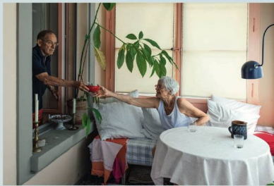
Hausgemeinschaft «Füfefüfzg» in Bern: Autonom, aber nicht allein.

Die neueste Ausgabe der Architektur-Fachzeitschrift «werk» beschäftigt sich schwerpunktmässig mit dem Thema «Wohnen im Alter». «Ist Alterswohnen wirklich so anders?», fragt allerdings Chefredaktor Daniel Kurz im Vorwort zur Ausgabe. Eigentlich nicht: «Für die allermeisten älteren Menschen ist es nichts anderes als das Gewohnte: den Tag verbringen, lesen, Hobbys pflegen, Freunde empfangen, ausgehen.» Trotzdem: Es ist auch anders. Viele ältere Menschen leben allein – «nach dem Ende der Familienzeit, vielleicht dem Tod des Partners». Dazu kommen kleinere und grössere Einschränkungen, abnehmende Mobilität und damit die Frage: Wie lange kann ich noch selbstständig wohnen? «werk» zeigt, dass es Wohnformen gibt, die das autonome Wohnen ausserhalb der Institutionen möglich machen. Es sind gemeinschaftliche Wohnformen in hindernisfreien Räumen, mit geeigneter Grösse