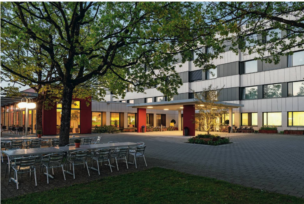
Der Reusspark in Niederwil AG: Das Haus mit 300 Betten plant mit der Intercare-Studie auch ein ganz besonderes Modell. Dieses soll dem Mangel an Geriatern abhelfen.