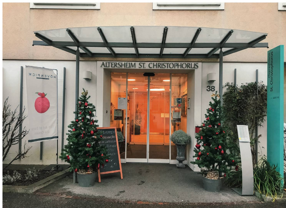
Das Altersheim St. Christophorus in Basel: Der Betrieb zählt nur 68 Betten, dafür haben die Leiterin und ihr Team grosse Visionen.