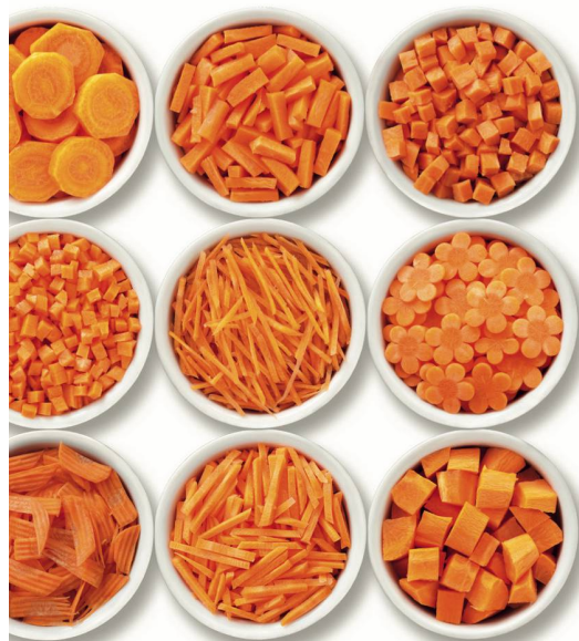
Sortimentserweiterung – von der Breite in die Tiefe