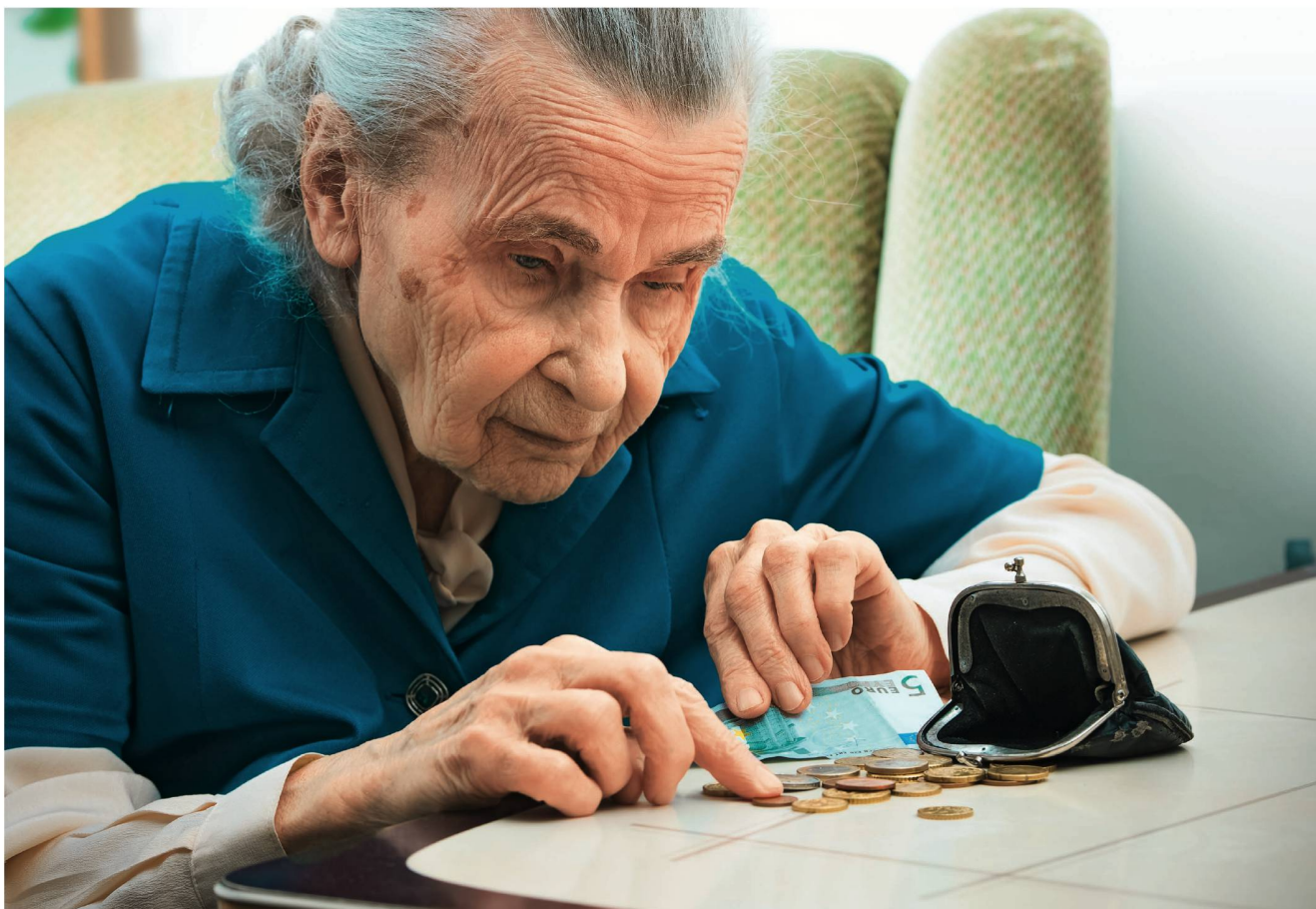
Wie viel eine betagte Person selber an die Pflegeheimkosten zahlen muss, hängt stark von ihrem Wohnort und ihrer finanziellen Situation ab.

Rentnerinnen und Rentner hat höheres Einkommen und Vermögen und die andere Hälfte ein tieferes. Mit dieser finanziellen Ausgangslage kann Frau Meier Ergänzungsleistungen zur AHV beantragen, damit diese einen Teil der Pflegeheimkosten übernehmen. In den meisten Kantonshauptorten trägt sie aber den grössten Teil der Pflegeheimkosten selbst (zwischen 53 Prozent in Fribourg und 90 Prozent in Luzern). Die beschrifteten Säulen in der Grafik 1 entsprechen den verrechneten Pflegeheimkosten. Das sind die Kosten, die Frau Meier als Rechnung vom Pflegeheim erhält. Die schwarze Linie in der