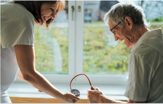
Übungen zur Kräftigung der Handmuskeln: Mit «Do-Health-Gruuven» kann man gezielt trainieren.

erwachsene Menschen. Jeder Gruuve legt den Fokus auf einen bestimmten Schwerpunkt, der zu Beginn des Gruuves eingeblendet wird. So kann man beispielsweise gezielt Wirbelsäulendrehungen ausüben oder die Handkraft trainieren. Alle können gruuvn – die kurzen Einheiten eignen sich aber besonders für ältere Menschen oder jene, die nicht die Kraft oder nicht genügend Vertrauen in ihr Gleichgewicht haben für