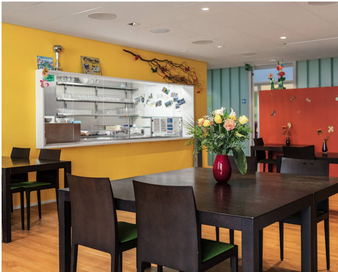
Cafeteria im Tageszentrum von Traversa Luzern: Ein freundlicher Ort und eine niederschwellige Begegnungsmöglichkeit für Menschen mit psychischer Erschütterung.

Die Sozialberatungsstelle, zu Gründungszeiten das Herzstück von Traversa, ist auch heute noch ein gefragtes niederschwelliges Angebot. «Alle Sozialarbeiterinnen haben viel Erfahrung in der Beratung von Betroffenen und sind spezialisiert im Umgang mit Menschen mit psychischer Erkrankung», sagt Limacher. «Sie helfen Betroffenen dabei, ihren Pflichten nachzugehen, wie Rechnungen und Steuern zu bezahlen, selber eine Wohnung zu mieten, Fragen im Umgang mit Behörden oder der Sozialversicherung zu klären oder psychosoziale Probleme anzugehen.» Heute bietet neben der Sozialberatungsstelle auch das Tageszentrum eine niederschwellige Möglichkeit für Begegnungen: Besucherinnen und Besucher hinterlassen ihre Telefonnummer und Adresse, aber ein Dossier über sie wird nicht geführt. Im Schnitt rund 40 Personen kommen täglich vorbei. Manche trinken einen Kaffee und lesen eine Zeitung, andere besuchen einen der Kurse aus den vielfältigen Angeboten wie Kochen, Sprachen, Sport, Entspannung oder Computer, wiederum andere nutzen das Internet. «Während den Öffnungszeiten stehen immer Betreuungspersonen