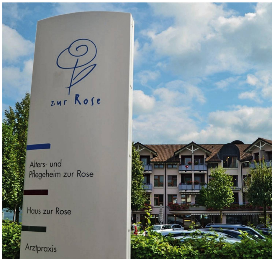
Alterszentrum Zur Rose Reichenburg: Hier befinden sich auch die Altersberatungsstelle und eine Arztpraxis.