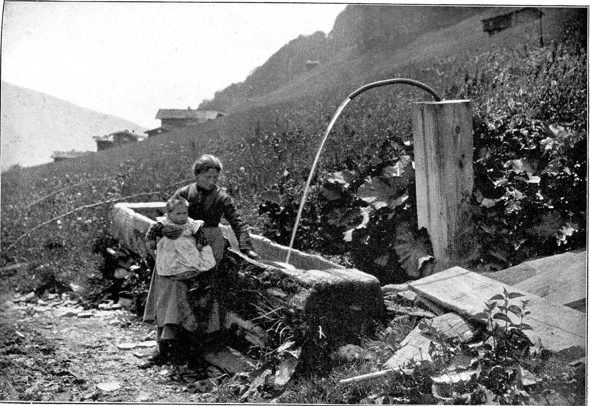
Gliché u. Druck: „Polygraphisches Institut Zürich.“