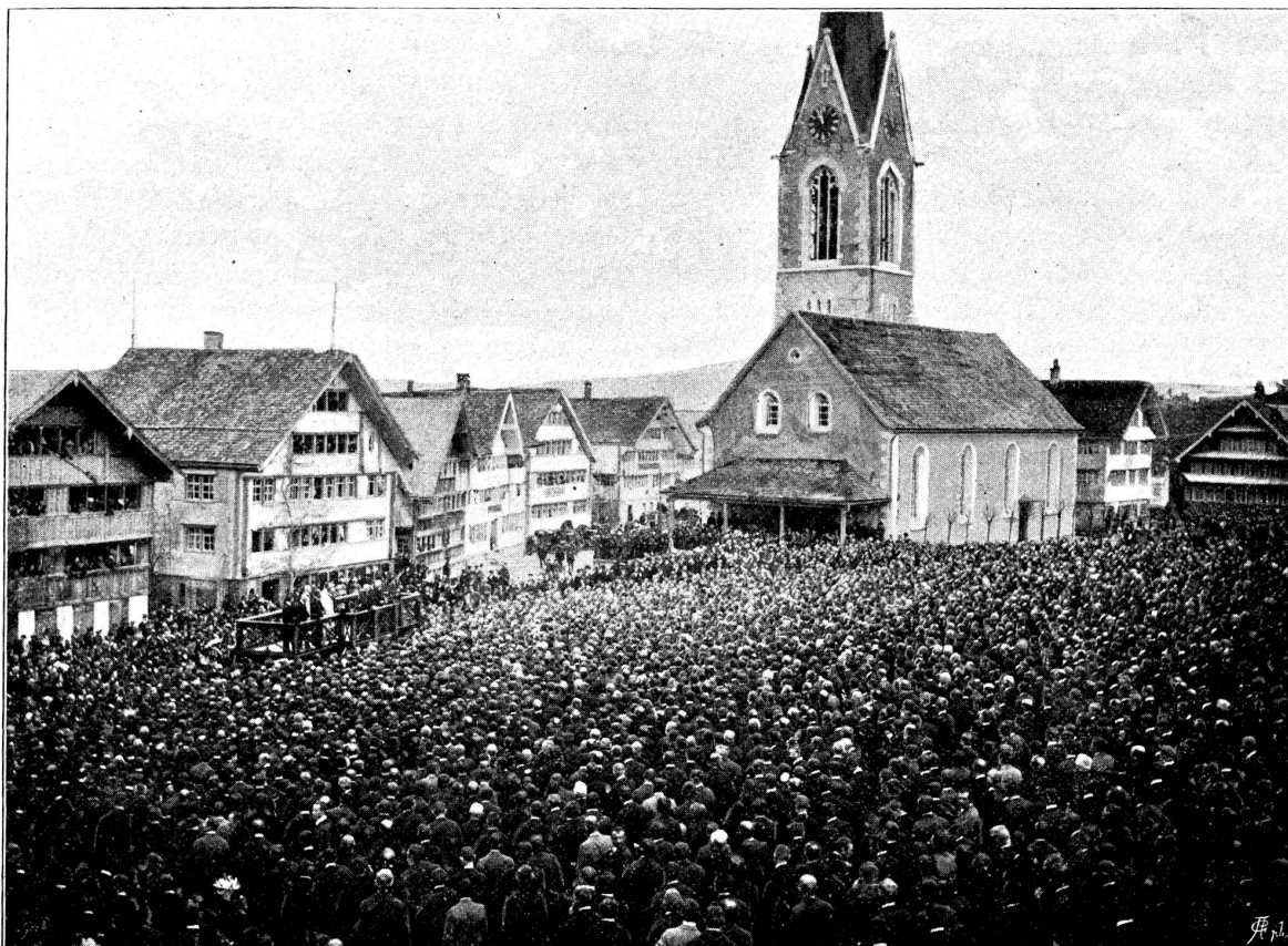
Landsgemeinde in Gumbühl (Appenzell A. Rh.) 1897. (Siehe S. 58 u. f. f.)

Der Vollenweider war es auch, welcher Tiesel nach geschehener Begräbnis das freundliche, väterliche Anerbieten machte: 'Zieh' Du mit mir nach Haus', Mädchen! Ich und meine liebe Alte können Deine vortrefflichen,