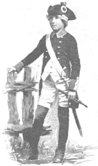
Marauer Kadett von 1798.

Der Landvogt von Wattenwyl, in Begleitung der Cavaliere und des Standesweibels von Bern, racht als Diplomat der Linmatfart, welche zu seinem Empfang die mit Hellerbarde, Pike und Partisane ausgestattete Jungmannschaft entgegenendet, einen würdevollen, freundlichen Einzug bereited.