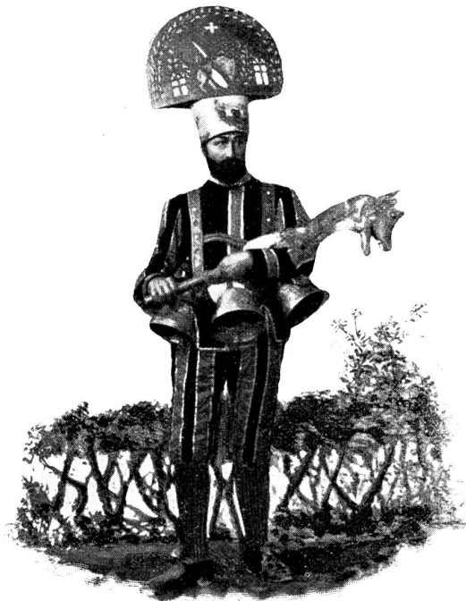
Aus der „Chrungelinacht“.

— Leih mir Flügel, schleierumwallte Huldgestalt, die du auf prunkvoll geschmücktem, mit aller Blütenpracht ausgestatteterm Zauberpalaß an uns vorüberziehest — leih mir Flügel, duftige Märchenfee, die mich zurücktragen in jenes magisch verschleierte Traumland der Kindheit, da zur traulichen Dämmerstunde, von liebem Mund heraufbeschworen, die Lieblinge aus der Märchenwelt den Frohreichen um uns führten. Doch sich — da nah'n sie ja — verkörpert zur schönen, glanzvollen Wirklichkeit. Listig blinselt die Frühlingssonne auf den hübschen Mattenfänger von Hameln hernieder, der Nache nimmt am ungetreuen Magistrat und mit seiner Zauberpfeife die blühende Kinderschar der Stadt hinauslockt zum verderbenden Abgrund. Und weiter wundert es Frau Sonne, daß sie den Schnee um Schneewittchens Totenbahre nicht schmelzen, die betäubten sieben Zwerglein „über den Bergen“ nicht aufheitern, das schöne scheinotere Mägdlein im schimmernden Glassarg nicht auferwecken kann. Mut lacht sie den sieben hübschen Schwaben zu, die sich krampfhaft an den geliebten Spieß klammern, um das Abenteuer mit dem lustig voraushüpfenden Hasen zu bestehen, und wohlgefällig sprachl sie herab auf die ganze Prachtentfaltung des neckischen Müllermärchens „der gestiefelte Kater!“ Der ganze fürstliche Hofstaat, vom Oberjägermeister bis zur Jose im Kostüm Louis XIV., teils hoch zu Ross, teils in glänzenden Karossen, zieht er vorüber