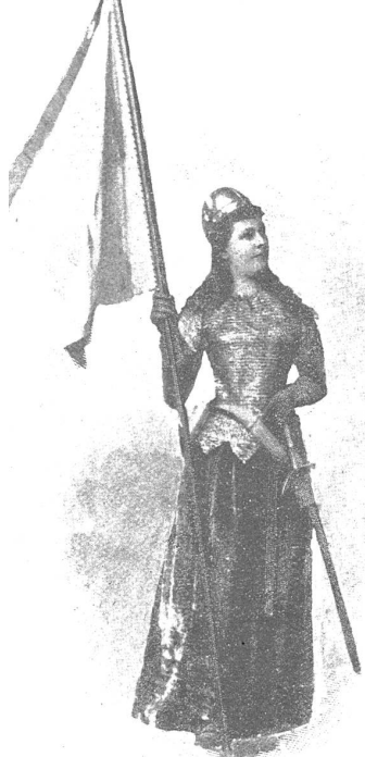
Pannerträgerin der Zürcher Mädchen auf dem Lindenhof.

Unhörbar, ungesehen waltet eine ernste, grau verhüllte Frau. . . Historia heißt einherzieh'n Assyriens Jugendblüte. Angeführt vom assyrischen Hölbling hoch zu Ross, von bewaffneten Krieger'n schwingt freudig die Palmenzweige die farbenreich gekleidete, buntbeschnürte Mädchen'schar, Salmanaſſar begrüßend zum Siege. Und weiter raunt Historia den Namen Salomos des großen Orientbeherrschers, zu dessen Tempel die israelitische Knaben'schar wallfahrtet, das braune, schwarzgelockte Haupt beschattet vom weißen Pilgerhut, die kleine Faust bewaffnet mit dem Pilgerstab, die Pilgrimsfirbisflasche um die Lenden gegürtet.