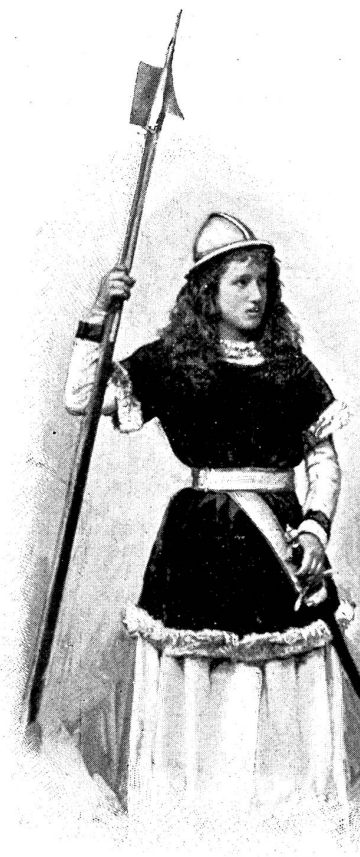
Zürcherin vom Lindenhof

das Wollen der Zurückgeblieber. La rafft sich die Schar der Kinder auf, um in den Kampf zu ziehen. Voran der junge Bauer zu Pferde, den Morgenstern schwingend, ihm nach, mit dem Kreuzesorden an der linken Schulter, unter dem Schutz der Kreuzesfahne, im buntschönen Kriegsgewande die Ritterknaben, mit kampfbereiter Lanze, die jungen Gelfräulein im verzieren Sammt-häubchen und geschürztem, reich verbräutem Oberkleide — Bürgerkinder, Bauernknaben und Dirnlein vom Lande, alles in treu historischer Hülle, ziehen kriegsfroh vorüber. Bewunderung zollte man der schönen Schar in der Jetztzeit — Mitleid den armen Getäuschten von damals.