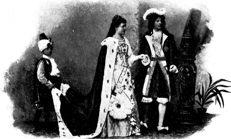
Märchen vom gestiefelten Kater: Das Fürstenpaar.